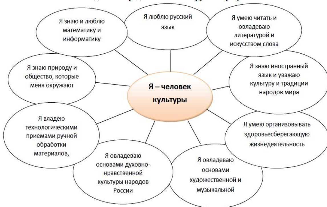
Модель 3. Предметные планируемые результаты.

Учитывая возможности, интересы и потребности обучающихся, обучение может выходить за рамки базовых знаний, в образовательной программе установлены планируемые результаты повышенного уровня сложности и представлены в столбце «Ученик получит возможность научиться» (выделены курсивом).